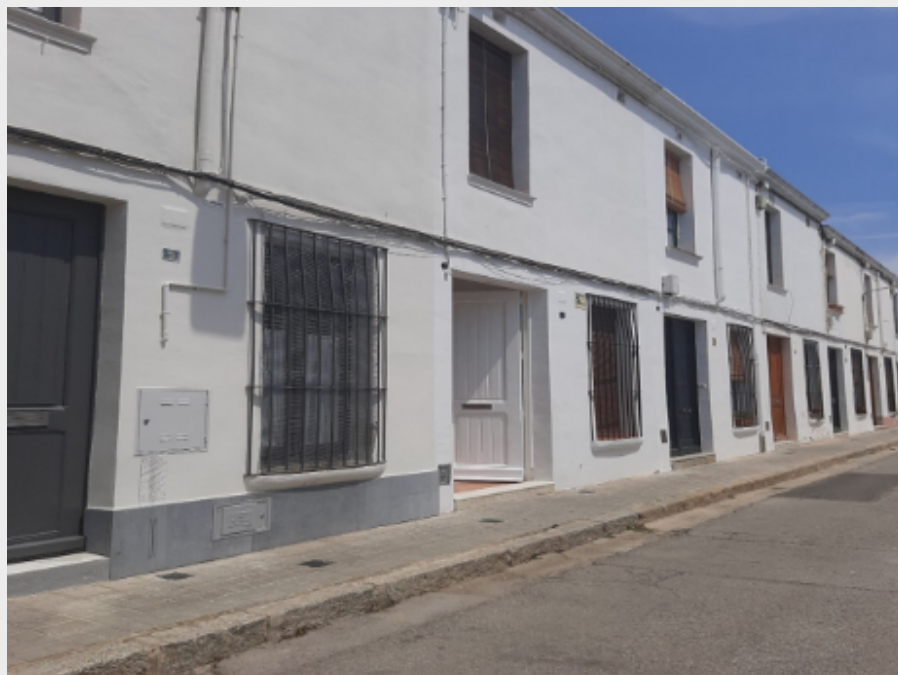
Cases de cos del Carrer Colom

Aquestes cases de cos són del segle XVIII i eren l'habitatge dels pescadors catalans. Una imatge molt característica de les viles del Maresme era la de les cases de cos mirant l'horitzó a primera línia de mar, amb l'entrada plena de tots els estris de pesca recolzats a la paret, i al darrere el pati i el safareig.